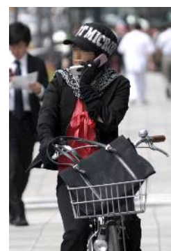
例えば、携帯を掛けながら自転車に乗る姿、これはダメ

他のコンクールでは問題なくとも、発表が大部数の新聞紙面という性格上、作品内容に慎重になる部分があります。被写体への肖像権は撮影者が了解を得てください。了解を得ずに撮影された作品でトラブルが予想される場合は入賞を取り消す場合があります。プライベートな空間（例えば電車の中）で撮られた作品、社会的ルールを侵している場面を収めた作品（自転車の二人乗りなど）、違反行為を助長するような作品（壁の落書き）などは審査に出されても選外となる場合がありますのでお気をつけください。規定の線引きには難しいものがありますが、「新聞掲載」を考慮すればだいたい判断がつきます。分からない場合は月例会場で事務局員か理事にお尋ね下さい。