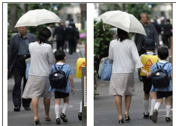
被写体、画角とも同じ、この場合は類似と見なされる

過去に月例会や他のコンテストで入賞した作品と類似した同一作者の写真は応募することができません。たとえカットが異なっても連写による同じような図柄の作品の場合は類似と見なされます。「撮影者が異なる」「撮影時間が大きく異なる」「画角が大きくことなる」「被写体が異なる」ような場合は類似と見なされません。ただし、規定スレスレのところ類似と見なされない優れた作品を応募した場合に、入賞が続くようなことも考えられます。後は個人の考え次第ですが「連続入賞したが、クラブに居づらくなった」などの状況も予想されます。これではアマチュアが楽しく写真を学ぶ趣旨から大きく逸脱してしまいます。その辺のところをご理解の上、作品づくりをよろしくお願いします。