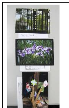
一点絞り前の作品

提出された作品は、月例会会場のテーブルに部門ごとに置かれ、審査が行われます。同一作者の作品は縦一列に並べられ審査員が一点に絞ります。「一点絞り」と言います。その後、自由部門、スナップ部門それぞれに最優秀賞1作品、優秀賞3作品、入選10作品、奨励賞8作品が決まります。